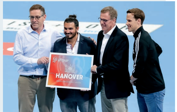
Präsentation der Spielorte: Deutschlands U21 startet in Hannover in das Turnier.

Alle Veranstaltungen bieten Trainern, Spielern und Handballinteressierten die einmalige Chance, sich Spiele auf Top-Niveau anzusehen und diese als „Weiterbildung“ für sich zu nutzen.