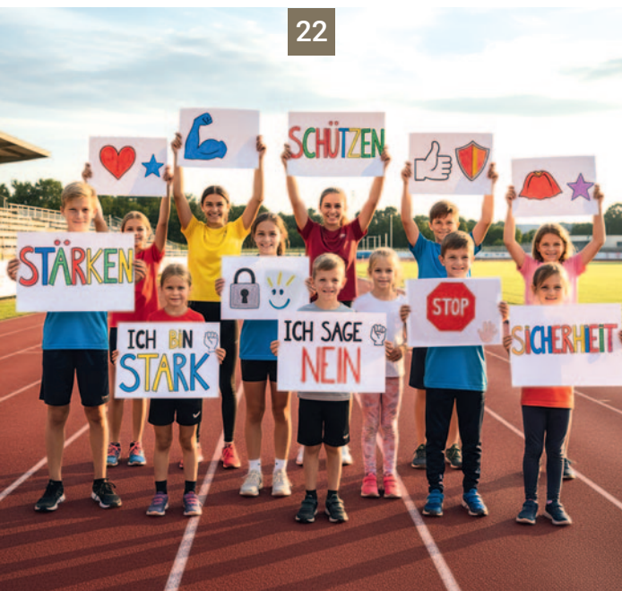
Fotos: K.J. Peters (oben), Miriam Balzer (Mitte), KI-generiert (unten)